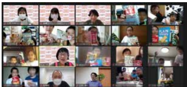
「災害に備える～お家にある備蓄品教えて～」

患者会にZoom貸出支援 2021年4月～2021年9月までに18回 貸出を行いました。