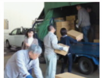
▲運び込まれる物資たち