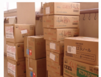
▲お米アレルギー用のケアライス、レトルトのカレー、ふりかけ、お菓子など