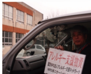
▲仙台に向けて出発