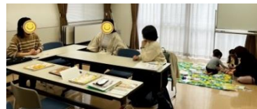
※交流会の様子(天白区内会場にて)

食物アレルギー、アトピー性皮膚炎、喘息など、アレルギーのあるお子さんのこと、アレルギーかな？とお悩みのある方、私たちと一緒にお話ししましょう♪さまざまな情報交換や、同じ悩みを持つ仲間作りの場にしていきたいと考えています。小児科で栄養指導をしている栄養士さんがアドバイザーとして参加予定です。