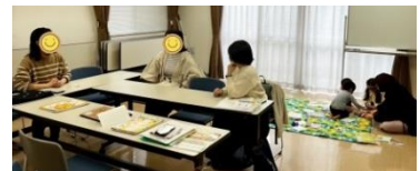
※交流会の様子(天白区内会場にて)

食物アレルギー、アトピー性皮膚炎、喘息など、 アレルギーのあるお子さんのこと、アレルギーかな?と お悩みのある方、私たちと一緒にお話ししましょう♪ さまざまな情報交換や、同じ悩みを持つ仲間作りの場 にしていきたいと考えています。 小児科で栄養指導をしている栄養士さんがアドバイ ザーとして参加予定です。